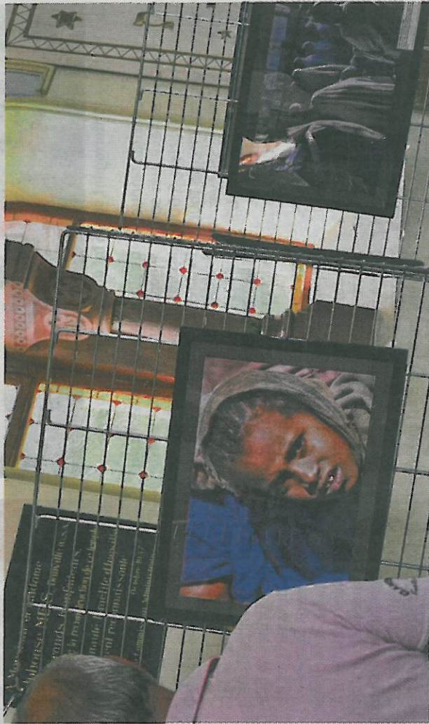
Une vingtaine de photos sont à découvrir.

Des bijoux et des objets culturels font également partie de cette exposition, comme par exemple des kippas multicolors